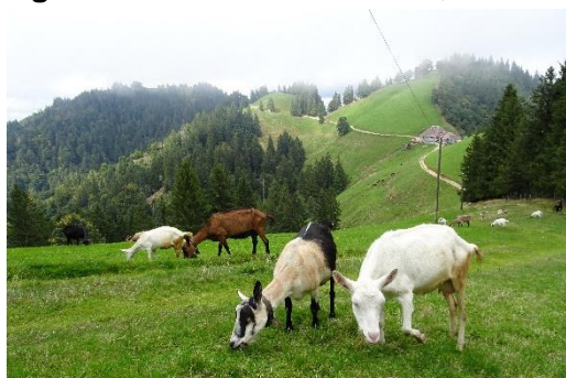
Stächelegg, hinten links im Nebel der Gipfel des Napf