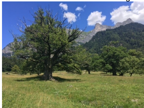
Eichenhain in Maienfeld