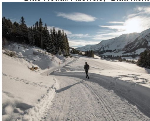
Aufstieg nach Flühüttelau